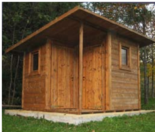
. casetta addossata