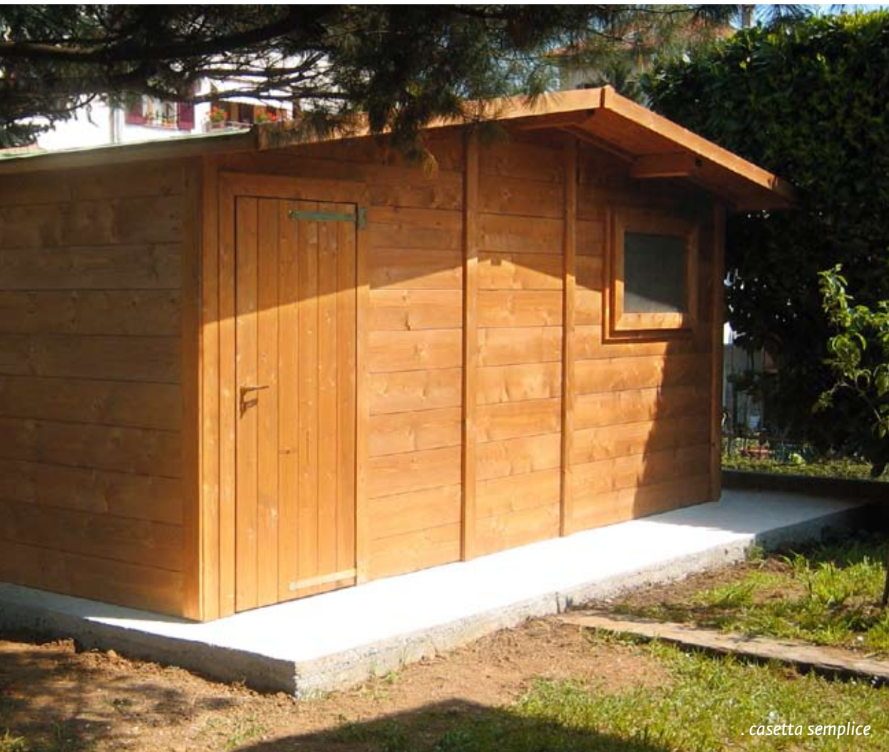
. casetta semplice