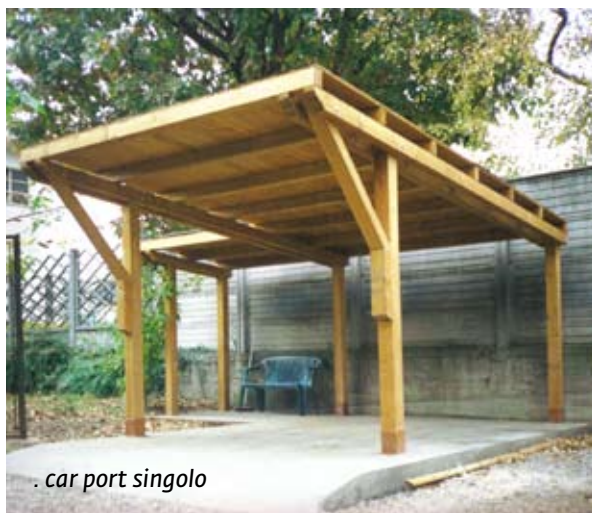
. car port singolo

I nostri car port sono strutture studiate per trovare il compromesso ideale tra ambiente, eleganza e un pregiato effetto architettonico.